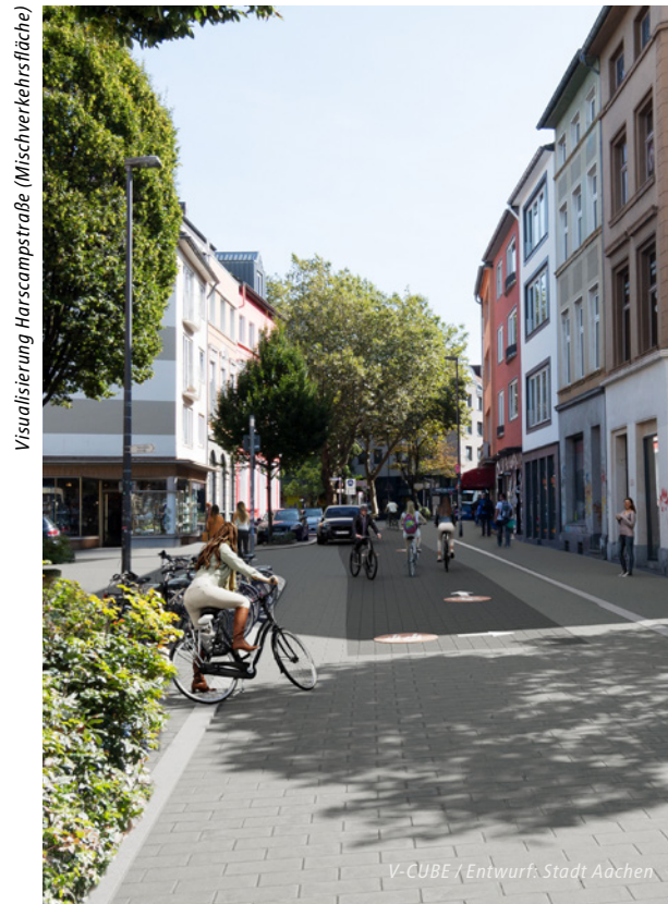
Visualisierung Harscampstraße (Mischverkehrsfläche)