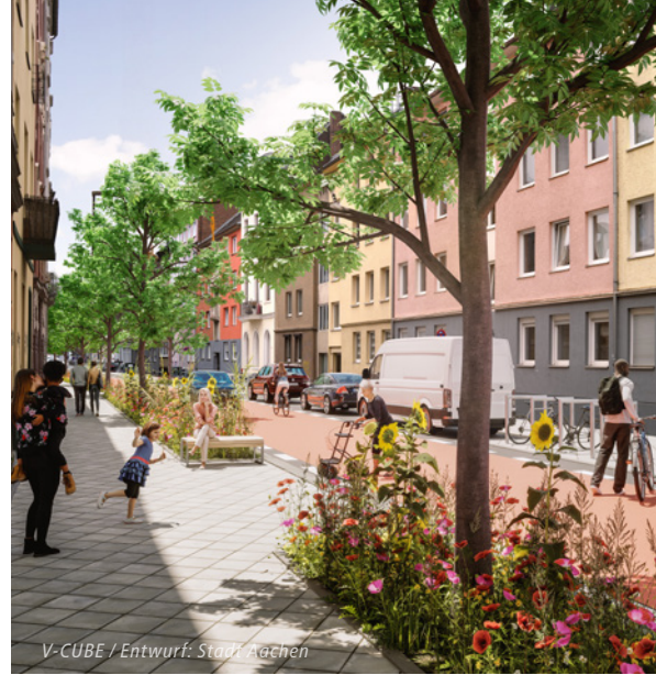
Visualisierung Krakaustraße (Premiumfußweg mit Fahrradstraße)

Die heutige Idee der neuen Verkehrsführung in der Innenstadt gehört zum Gesamtpaket „Innenstadtmobilität für morgen“, das die Stadtverwaltung seit 2022 entwickelt. Vorausgegangen waren Ratsanträge in den Jahren 2019 und 2020: für weniger Schleichwege und für eine lebenswerte Innenstadt.